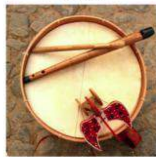
Flauta de Tamborileiro